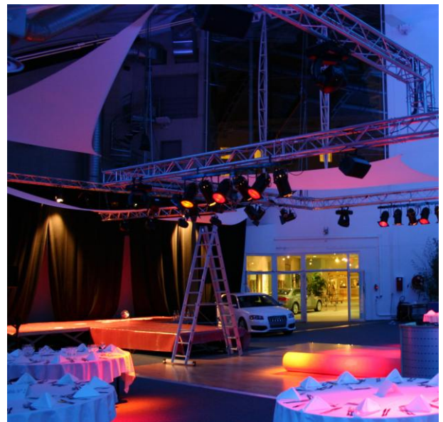
50 ans Lions Club Belfort 2008