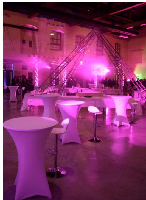
5 ans Téléperformance 2010