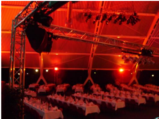
Vœux Belfort 2007